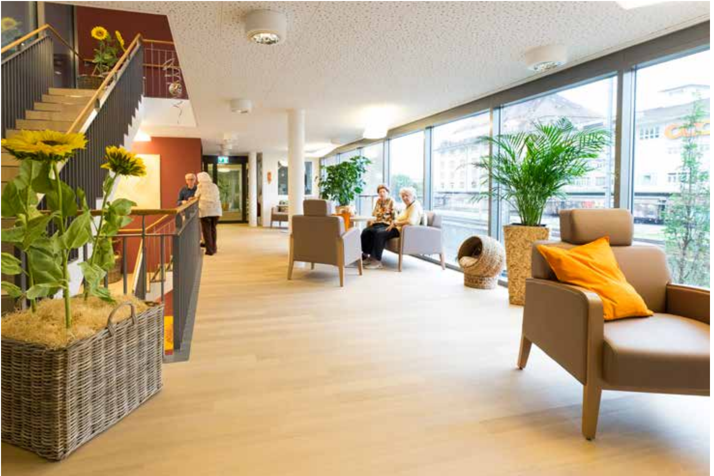
Bewohnerinnen und Bewohner moderner Altersresidenzen wie der Senevita Sonnenpark in Pratteln geniessen ihren Lebensabend in komfortabler und sicherer Umgebung.

dürftigkeit bis zu 66 Prozent bei den über 90-Jährigen an. Altersgerechtes und betreutes Wohnen wird also immer bedeutender. Glutz hat sich damit intensiv auseinandergesetzt und erstklassige Lösungen im Bereich Zutrittssysteme entwickelt.